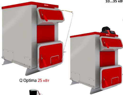
Q Optima 25 кВт