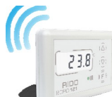
Комнатный термостат Komfort 121