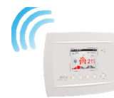
Комнатный термостат Komfort 161